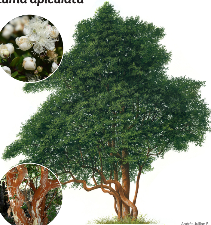
Andrés Jullian F.

Árbol o arbusto siempreverde, de hasta 25 m de altura. El tronco es generalmente torcido y llega a medir unos 50 cm de diámetro. Su corteza es lisa, de color rojizo y se desprende periódicamente, dejando sectores blancos. Destaca por su pequeña flor, de color blanco cremoso, y tallo de color anaranjado en árboles jóvenes y adultos.