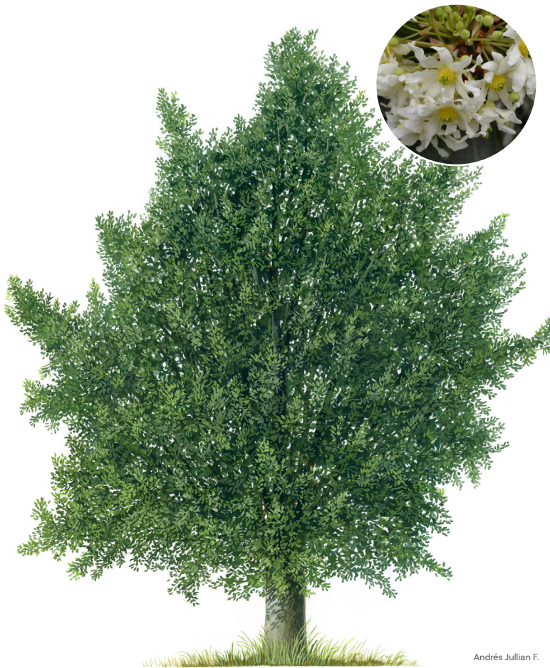
Andrés Jullian F.

Árbol siempreverde, de copa piramidal, a menudo compacta. Llega a medir hasta 30 m de altura y su tronco 1 m de diámetro. La corteza es gruesa, lisa, blanda y de color grisáceo. Sus hojas son de las más grandes en la flora arbórea chilena, miden entre 5 a 15 cm, con una notoria diferencia de coloración entre la cara superior que es verde claro y la inferior, verde grisácea o blanquecina.